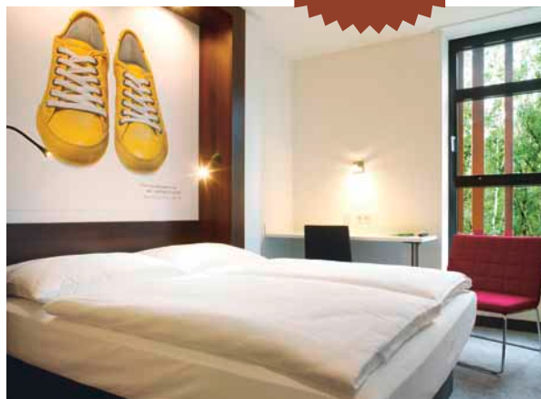
my basic single/double