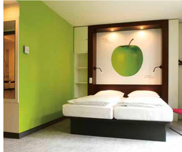
my basic large